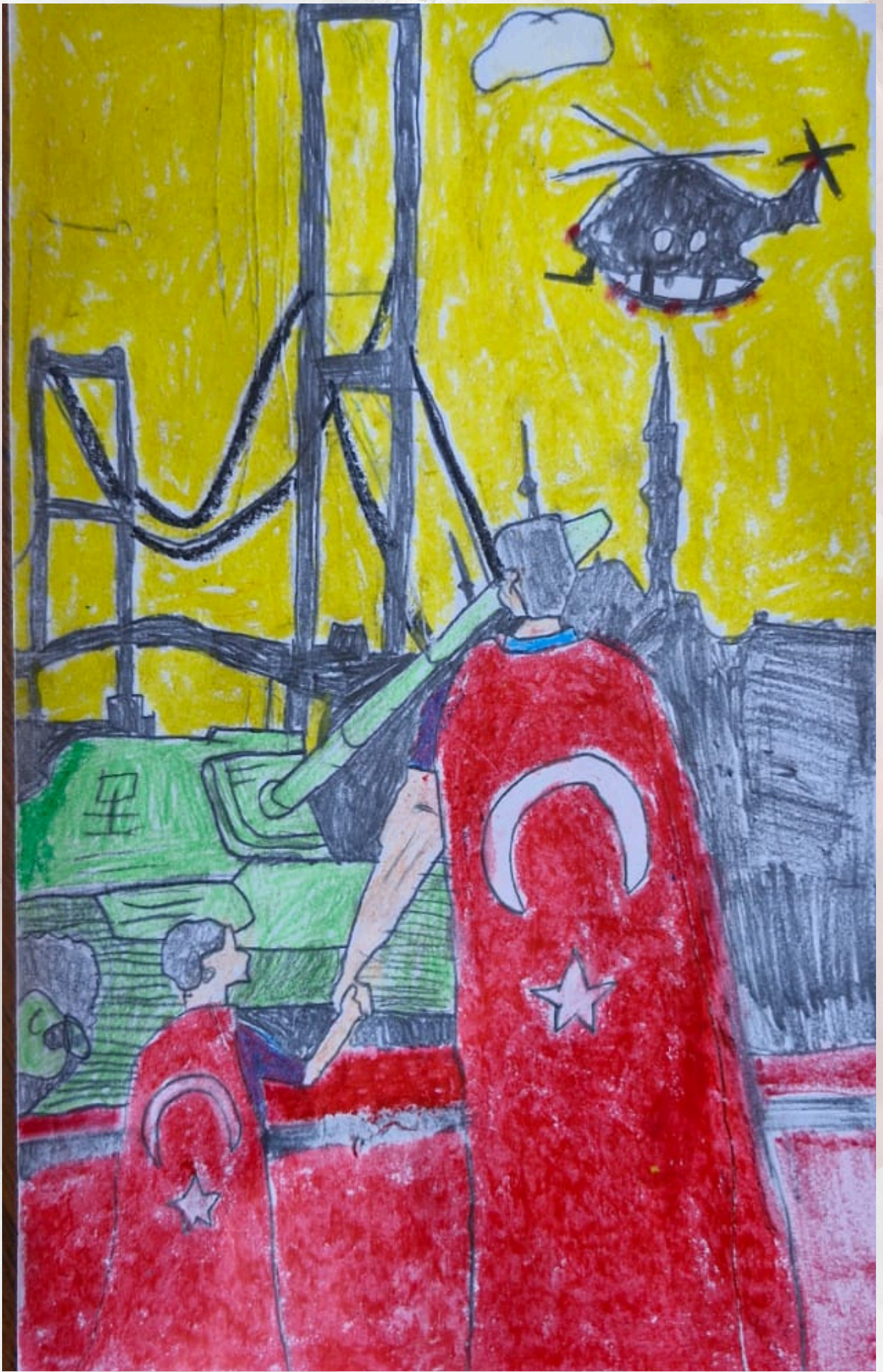
UMUT ÇETİN DOĞAN 6/B SINIFI